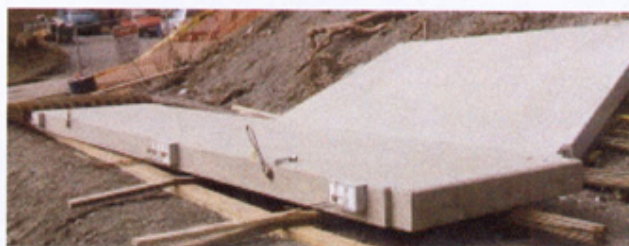
Svalgangselementer med Isokorb Type Q