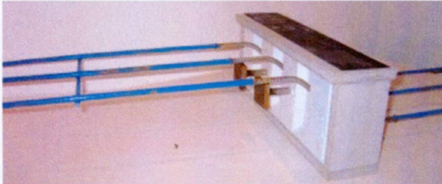
Sett fra dekkesiden.