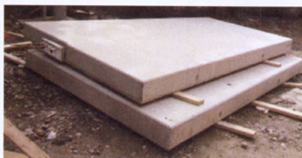
Balkongelementer med Isokorb Type Q